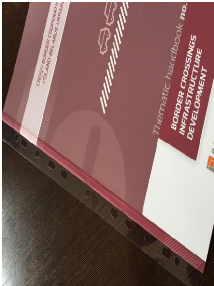
Przykładowa listwa pvc przyklejona do grzbietu publikacji