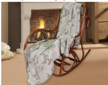
Koc po rozłożeniu