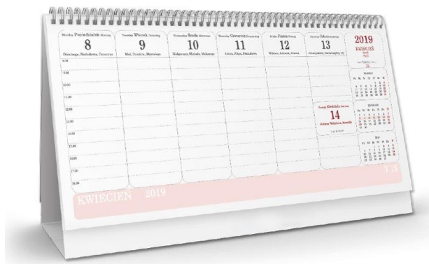
Przykładowy wygląd strony.