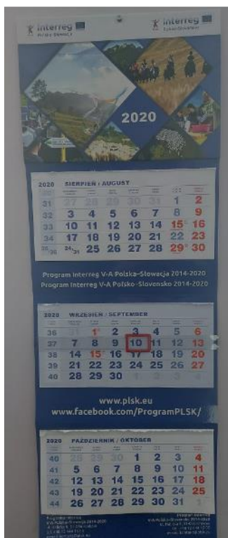
(Zdjęcie poglądowe kalendarza)