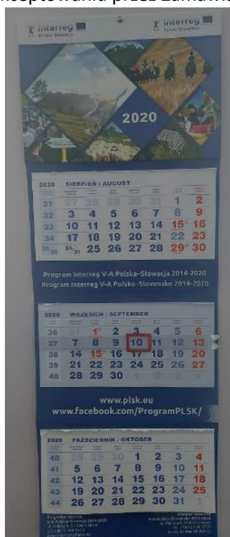
(Zdjęcie poglądowe kalendarza)

Każdy kalendarz w sztywnej kopercie, opakowanie zbiorcze 10 sztuk (inna ilość jedynie po zaakceptowaniu przez Zamawiającego).