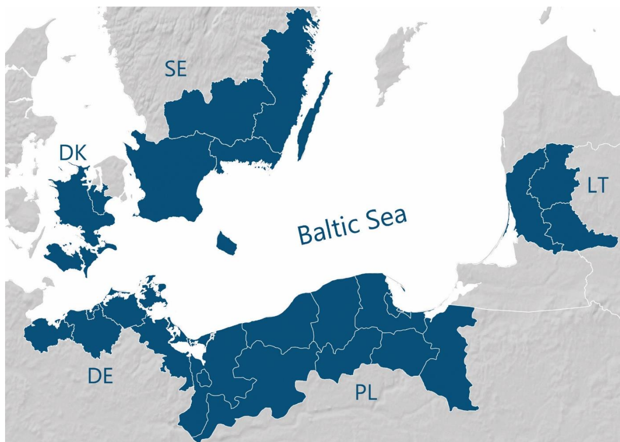
Ryc. 1. Obszar kwalifikowalny Programu Południowy Bałtyk