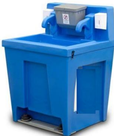
Przykładowe zdjęcie zestawu umywarek

Wykonawca zobowiązany będzie do wykupu ubezpieczenia odpowiedzialności cywilnej na czas trwania wydarzenia i usług towarzyszących na kwotę minimum 300 tys. zł. Po stronie Wykonawcy leżeć będzie również dowóz, ustawienie oraz wywóz przenośnych sanitariatów. Wykonawca zapewni co najmniej 8 sztuk przenośnych toalet wraz z umywalkami w tym jedną toaletę przystosowaną do potrzeb osób niepełnosprawnych. W ramach zamówienia Wykonawca ustawi również rząd połowych zewnętrznych umywarek. Każdy z zestawów powinien zawierać co najmniej dwa kranie. Wykonawca zapewni 4 zestawy, w sumie 8 kranów. Dodatkowo Wykonawca zapewni kosze na śmieci na terenie wydarzenia, tak aby cały teren został utrzymany w czystości zarówno w trakcie jak i po zakończeniu obchodów EC Day. Wykonawca na własny koszt wywiezie nieczystości stałe. Ilość koszy, co najmniej 8 sztuk, pojemność 100l.